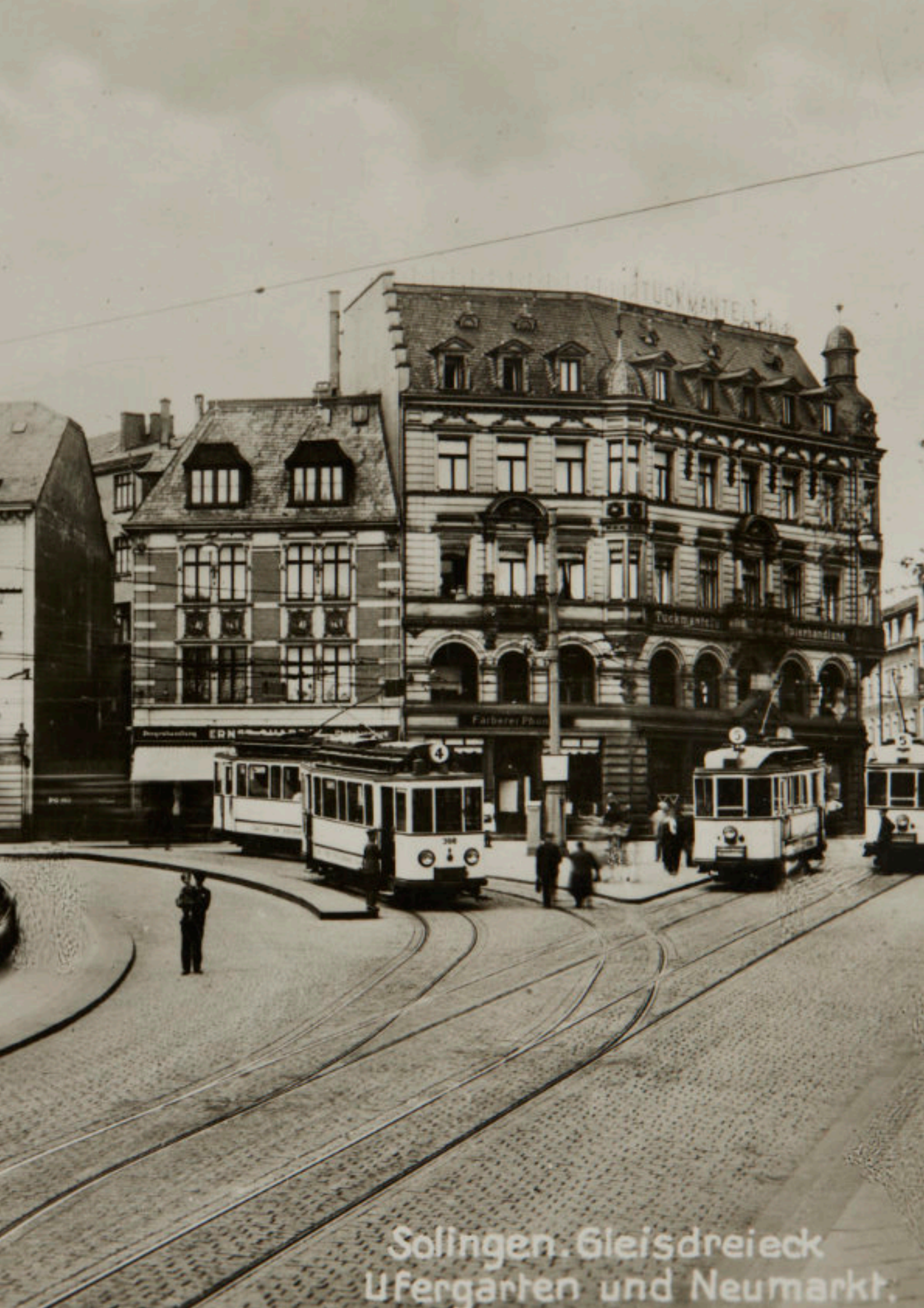
Solingen. Gleisdreieck Ufergarten und Neumarkt.